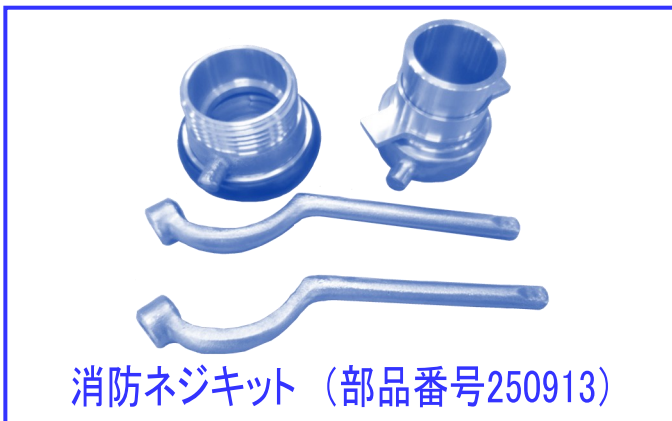
消防ネジキット (部品番号250913)