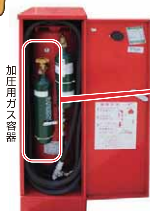
移動式粉末消火設備